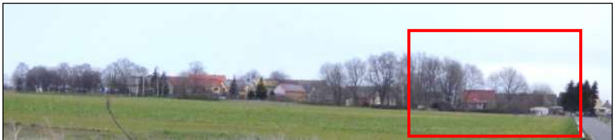
Abb. 15: Blick von außen auf den westlichen Ortsrand von Ochelmitz mit eingrünendem Gehölzbestand und Plangebiet (rot umrahmt)

Um den kleinen Ort herum dominieren weitläufige Ackerflächen das Landschaftsbild. Diese werden durch viele lineare Heckenstrukturen zwischen einigen der Flurstücke unterbrochen und die Strenge und Gleichförmigkeit des ackergeprägten Landschaftsbilds aufgelockert. Als besonders landschaftsbildprägendes Objekt zählt die Windmühle Liemehna (Abb. 17). Sie befindet sich am östlichen Ortsrand des Nachbarortes Liemehna und ist weithin sichtbar. Sie befindet sich nur etwa 400 m vom Geltungsbereich des Bebauungsplans entfernt.