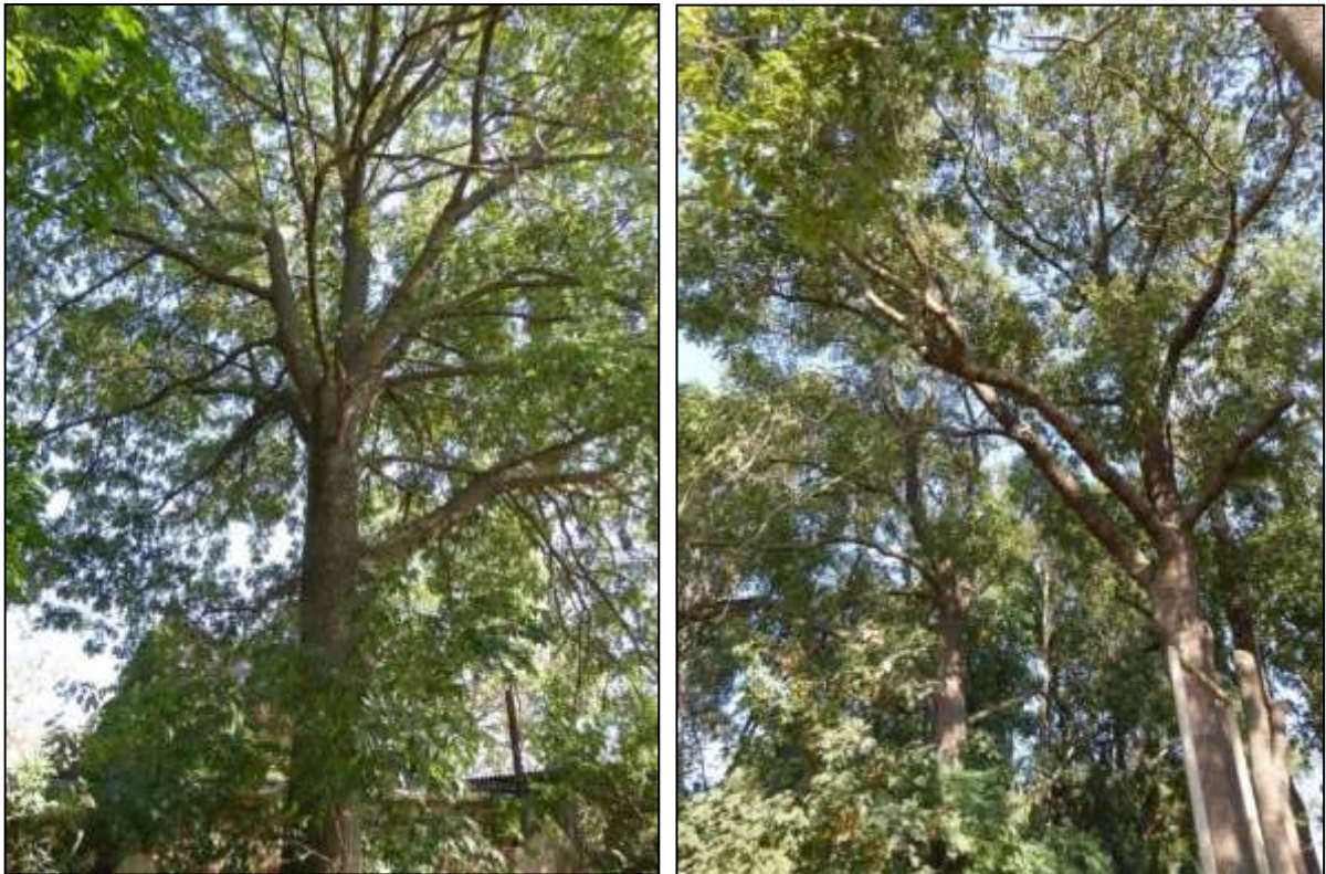
Abb. 4: ältere Eschenbäume im östlichen Plangebiet