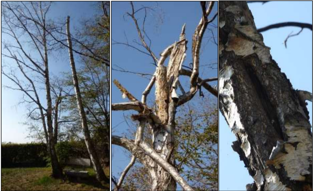
Abb. 6: abgestorbene Birken im Flurstück 30/1 mit Totholz (Mitte) und Spalten (rechts)