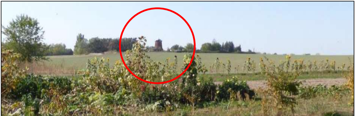
Abb. 17: landschaftsbildprägende, weitläufige Ackerfläche und Fernblick auf die Windmühle bei Liemehna

Gemäß REGIONALPLAN LEIPZIG-WESTSACHSEN (2021) befindet sich das Plangebiet angrenzend an landschaftsprägende Höhenrücken, Kuppen und Hanglagen (nördlich). Die landschaftliche Erlebniswirksamkeit um Ochelmitz herum wird mit „hoch“ bewertet. Die umliegenden Ackerflächen und die eingebundenen, linearen Hecken und Feldgehölze gelten als typisch und sollen erhalten bleiben. Am nördlichen Ortsrand von Ochelmitz verläuft ein Reitweg (Authausen - Bad Düben - Löbnitz - Wölpern - Gordemitz), Wander- oder Radwege sind im Umfeld des Ortes nicht ausgewiesen. Die historische Siedlungsform von Ochelmitz entspricht der eines Sackgassendorfes (Straße Zum Oberdorf). Die um die Gasse angeordneten Gehöfte haben große, nach Außen gelagerte Gärten, die den Übergang in die Landschaft bilden. Der Geltungsbereich ist durch die ehemalige Tankstelle der Landwirtschaft jedoch bereits baulich überprägt worden. Die frühere Gartenfläche mit den eingrünenden Baumbeständen wurde bereits vor längerer Zeit überprägt.