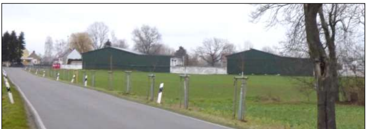
Abb. 16: Blick von Westen auf die großen, landwirtschaftlich genutzten Betriebsgebäude an der Biogasanlage am südlichen Ortsrand