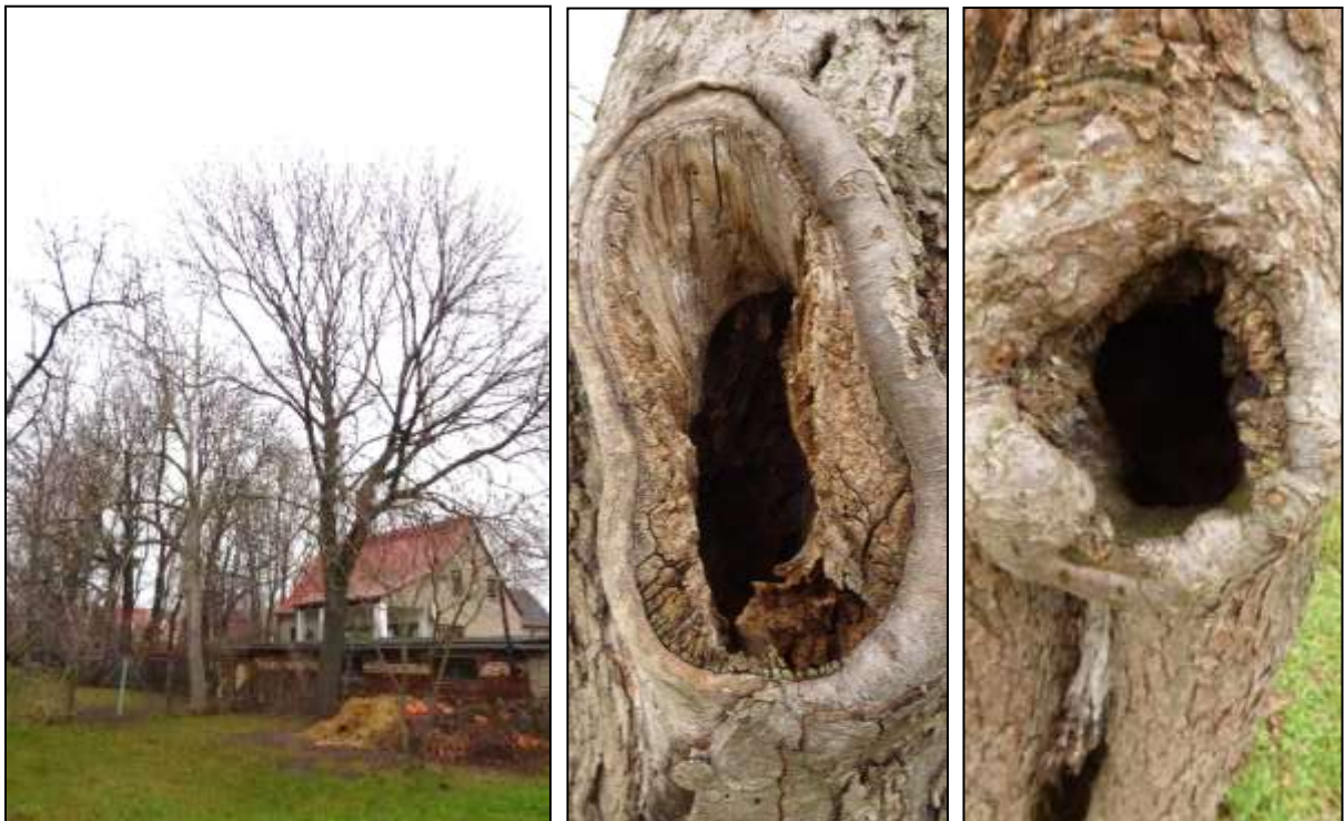
Abb. 21: Eschen-Bestand im unbelaubten Zustand ohne Hinweise auf Höhlen, Spalten, Risse (links), Höhle in Obstbaum (Mitte: obere Öffnung, rechts: untere Öffnung)