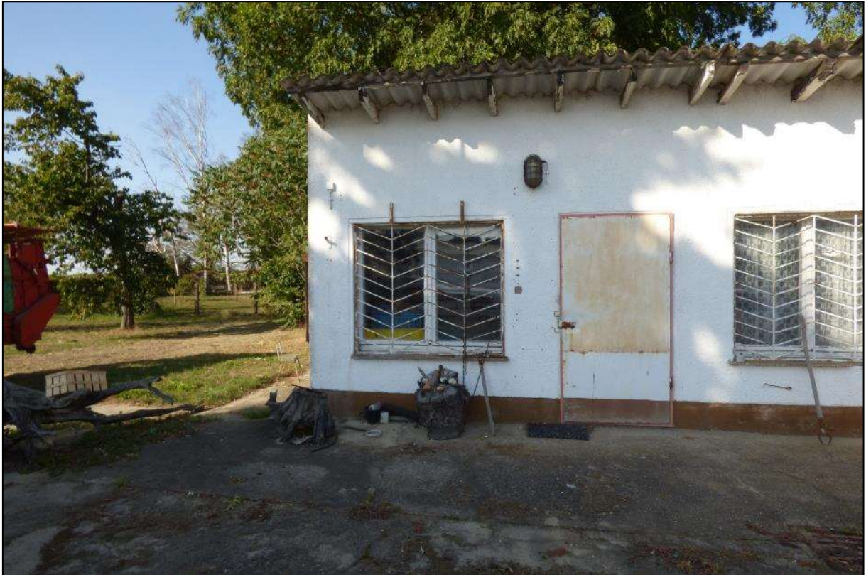
Abb. 8: ehemaliges Tankstellenhäuschen

abgebrochen. Im südwestlichen Bereich desselben Flurstückes ist in der gültigen Flurkarte noch ein Gebäude verzeichnet. Es handelt sich dabei um ein kleines Trafohaus. Dieses wurde in den vergangenen Jahren jedoch durch den Verantwortlichen versetzt und befindet sich nun außerhalb des Geltungsbereiches für den Bebauungsplan.