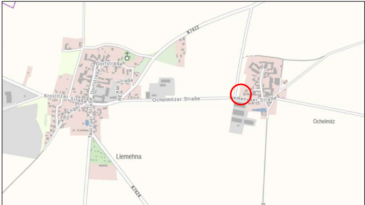
Abb. 1: Lage Plangebiet (RAPIS 2020, unmaßstäblich)

Das Plangebiet liegt am westlichen Ortsrand von Ochelmitz, an der Liemehnaer Straße. Östlich schließt sich unmittelbar Wohnbebauung an. Die geplante Zuwegung des Wohngebietes wird über die südlich verlaufende Liemehnaer Straße erfolgen. Hierzu besteht bereits eine Zufahrt innerhalb des Grundstückes. Zusätzlich ist eine Erschließung von dem westlich verlaufenden Wirtschaftsweg („Streitweg“) möglich.