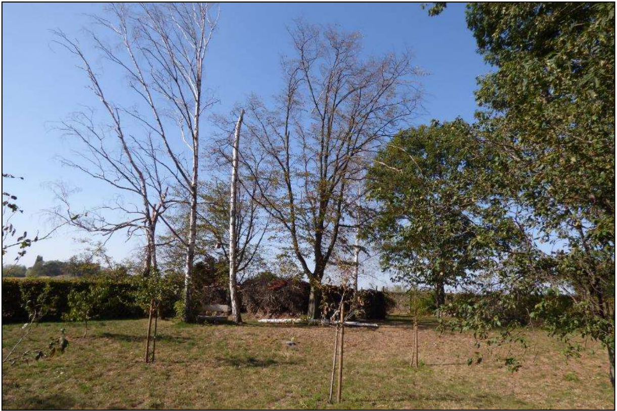
Abb. 11: Blick in den nördlichen Gartenbereich des Flurstücks 30/1 mit Sitzbereich