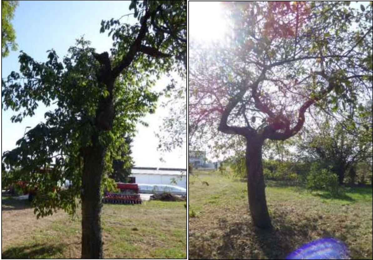
Abb. 3: die zwei älteren Obstbäume im Flurstück 30/1

Im nördlichen Bereich des Flurstückes 30/1 wurden im Jahr 2018 einige junge Obstbäume gepflanzt. Im südlichen Bereich des Flurstücks 30/1 befindet sich innerhalb einer Abstandsfläche, zwischen der Zufahrt und der Liemehnaer Straße eine Gruppe aus Fichten. Es handelt sich dabei um 8 unterschiedlich alte Bäume.