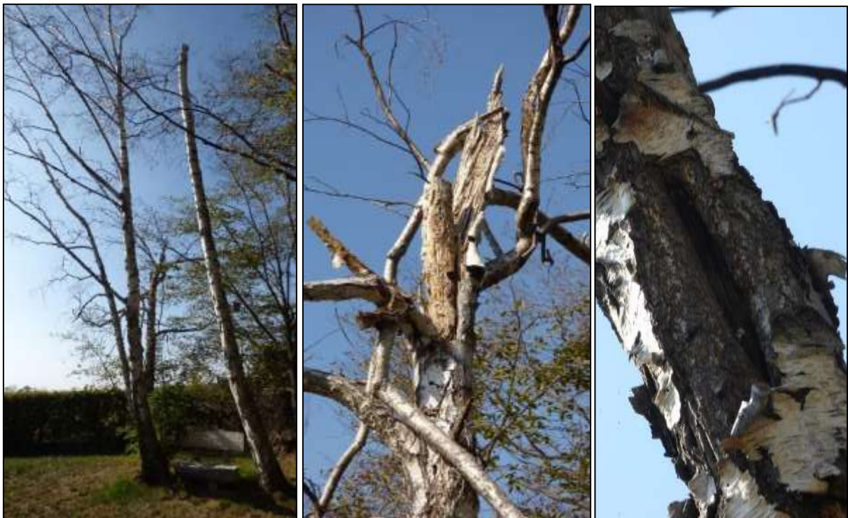
Abb. 20: abgestorbene Birken im Flurstück 30/1 mit Totholz, welches durch von Oben eindringendes Niederschlagswasser als Fledermausquartier ungeeignet ist (Mitte) und Spalten, die eventuell von Fledermäusen als Sommerquartier genutzt werden könnten (rechts)

Im nördlichen Bereich des Flurstückes 30/1 befinden sich abgestorbene Birken, die Risse/Spalten aufweisen und als potenzielles Sommerquartier dienen könnten. Dies trifft jedoch nicht auf die Birke zu, deren Spalten nach oben hin offen und somit ungeschützt gegen jegliche Witterungseinflüsse sind. Innerhalb der bestehenden, älteren Eschenbäume konnten bei den Begehungen im September 2020, sowie im unbelaubten Zustand im Januar 2021, keine Hinweise auf Totholz, Spalten, Risse oder Höhlen gefunden werden. In einem der beiden älteren Obstbäume befindet sich eine Baumhöhle, die zwei Öffnungen hat (ehemalige Astlöcher). Bei einer genauen Begutachtung der Höhle konnten jedoch keine Hinweise auf eine Nutzung durch Fledermäuse (bspw. durch Kotsputen) gefunden werden. Eine Nutzung, insbesondere als Sommer-/Zwischenquartier kann jedoch nicht generell ausgeschlossen werden. Vor Allem Großer Abendsegler und Wasserfledermaus sind baumbezogene Fledermausarten, welche die Höhlen und Spalten nutzen könnten. Allerdings befindet sich die Höhle nur etwa 1,00 m über dem Erdboden und ist für potenzielle Prädatoren (Katze, Marder) leicht erreichbar. Die umliegenden (Alt-)Baumbestände können jedoch ebenfalls Potenzial als Fledermausquartier bieten.