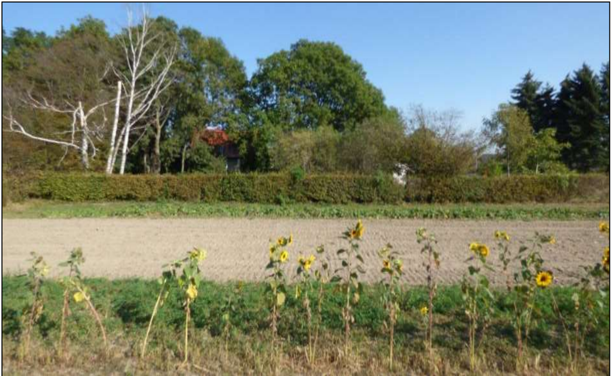
Abb. 9: Ackerfläche zur Selbstversorgung im Flurstück Nr. 29/5, dahinter Hainbuchen-Schnitthecke, dahinter Gehölzbestände des östlichen Geltungsbereiches