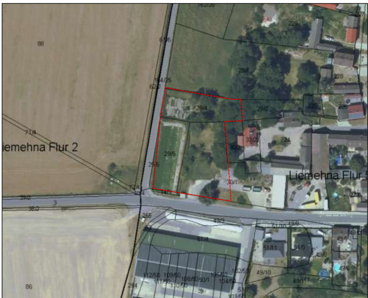
Abb. 14: Luftbild mit der Umgebung des Plangebiets (rot gestrichelt) am westlichen Ortsrand von Ochelmitz

Nördlich an das Plangebiet angrenzend befindet sich eine Wiesenfläche, die eine Abstandsfläche zwischen der Gemeindeverbindungsstraße und der Siedlungsbebauung bildet. Daran anschließend sind eingrünende Gehölzbestände mit zum Teil Altbäumen vorhanden. Hierdurch wird eine landschaftsbildsteigernde Eingrünung des Ortsteiles erzeugt.