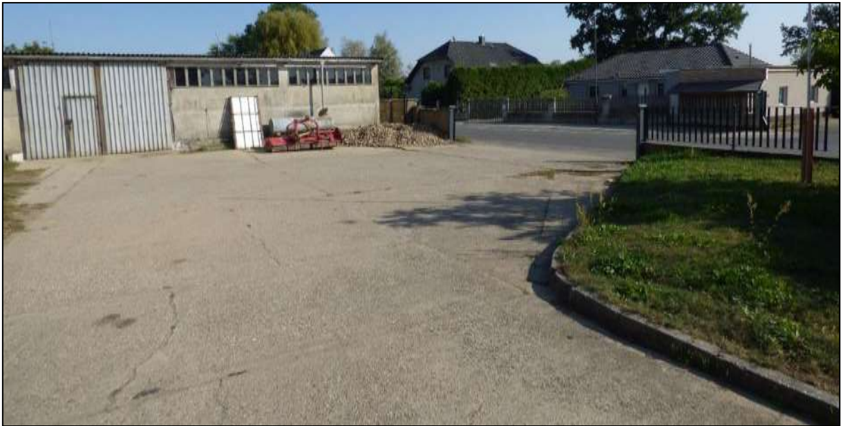
Abb. 12: östlicher Bereich der bestehenden Zufahrt mit Maschinenhalle (außerhalb Geltungsbereich) sonstige versiegelte Plätze (11.04.200) - Biotopwert: 0 WE

Im Bereich um das ehemalige Tankstellengebäude befinden sich noch versiegelte Flächen (Beton). Auch diese werden mittelfristig eines Tages abgebrochen und entfernt und die Fläche des Gebäudes und des Vorbereiches entsiegelt.