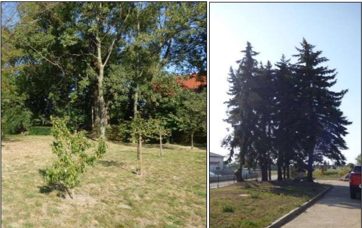
Abb. 7: gepflanzte junge Obstbäume und Grüppchen aus Fichten im Abstandsgrün