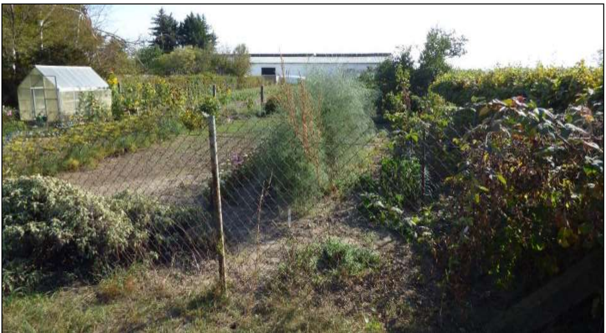
Abb. 10: Nutzgarten im westlichen Bereich des Flurstücks 29/4