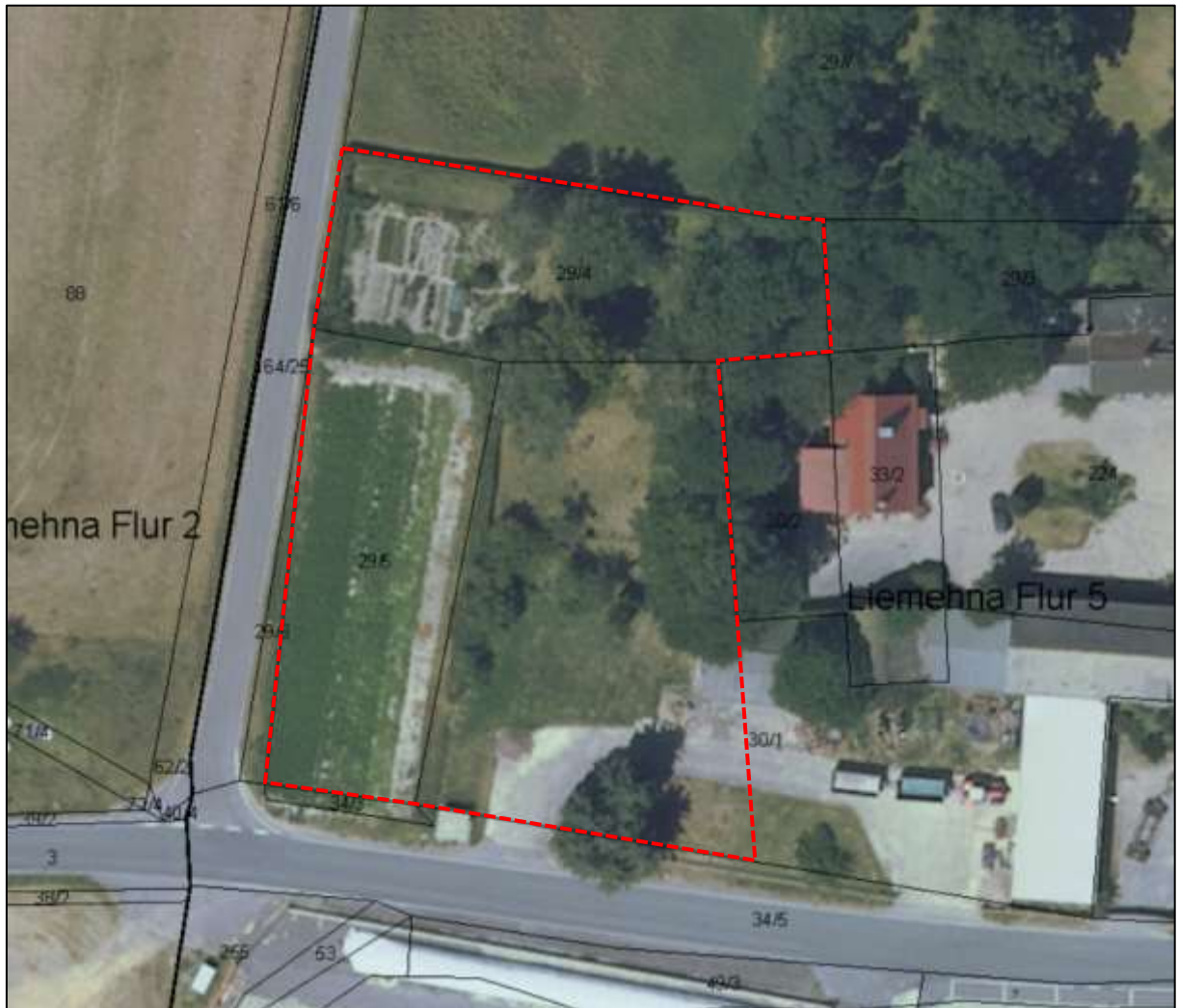
Abb. 2: Luftbild und Flurstücke mit Umrandung Plangebiet (rot) (RAPIS 2020, unmaßstäblich)

Im östlichen Bereich des Plangebietes befindet sich Baumbestand unterschiedlicher Ausprägung. Dieser besteht aus mittelalten bis älteren Eschen, insbesondere am östlichen Rand des Plangebietes (Abb. 4). Zudem sind fünf Birken in einem sehr schlechten Zustand (Trockenheit, Astabbrüche/Totholz, zum Teil umgestürzt) im nordwestlichen Bereich der Gehölzstruktur vorhanden (Abb. 6). Eine mittelalte Hainbuche befindet sich ebenfalls hier (Abb. 5). Zwei ältere Obstbäume stehen etwa mittig des Flurstückes 30/1 (Abb. 3). Auch diese in einem mäßigen Zustand. Im nördlichen Bereich des Flurstückes 30/1 befinden sich weiter 7 sehr junge Obstbäume, die 2018 gepflanzt wurden (Abb. 7). Es handelt sich hierbei überwiegend um Halbstämme. Am südlichen Rand des Flurstückes Nr. 30/1 steht eine Gruppe aus mittelalten und jungen Fichten im Bereich der Zufahrt (Abb. 7).