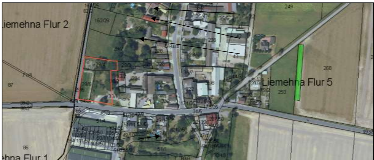
Abb. 19: Verortung und Darstellung Geltungsbereich B-Plan (rot) und geplante Kompensationsfläche (Feldhecke, grün) (aus RAPIS 2020)