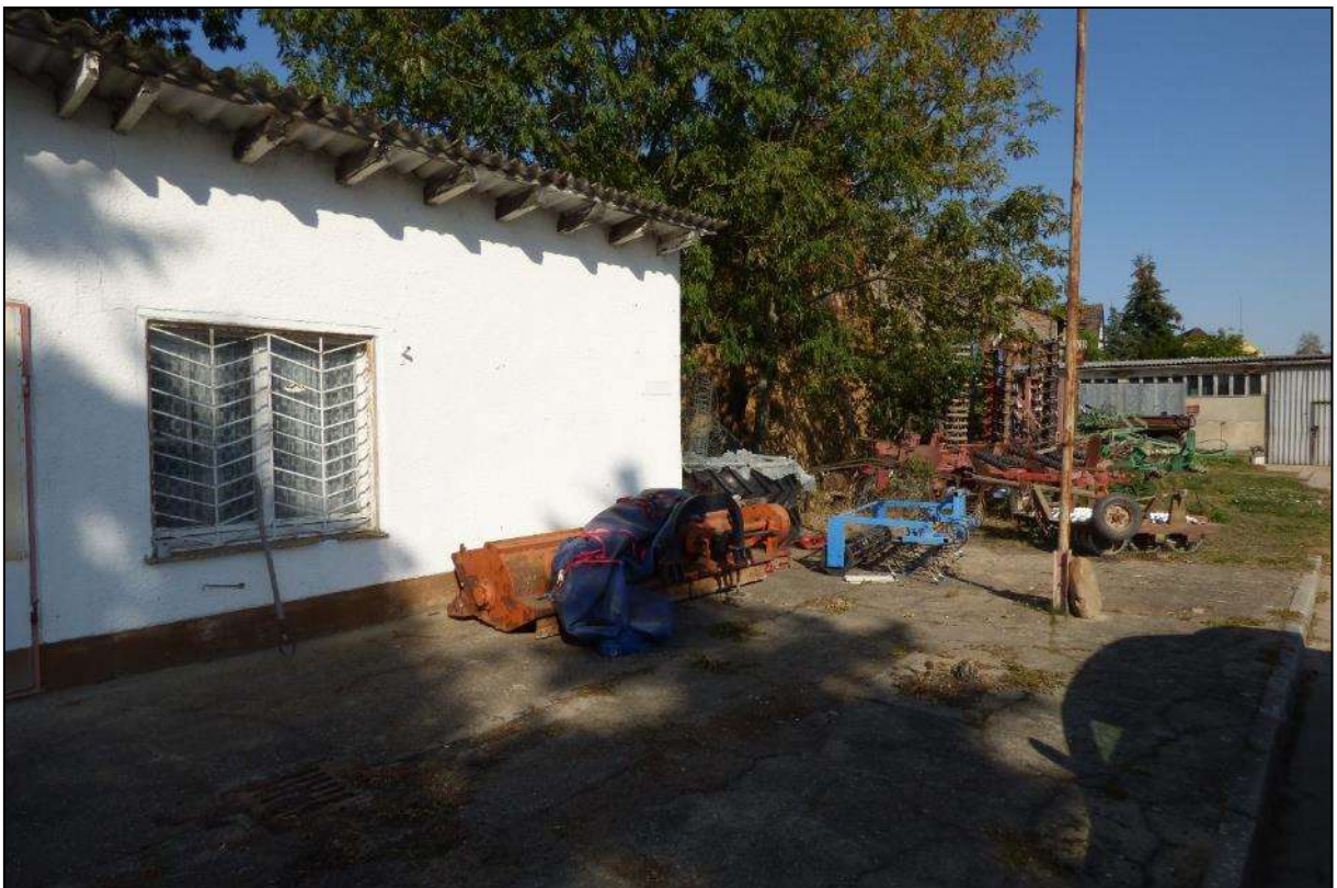
Abb. 13: Vorbereich des Tankstellenhäuschens (betonierte Fläche)

Im Bereich um das ehemalige Tankstellengebäude befinden sich noch versiegelte Flächen (Beton). Auch diese werden mittelfristig eines Tages abgebrochen und entfernt und die Fläche des Gebäudes und des Vorbereiches entsiegelt.