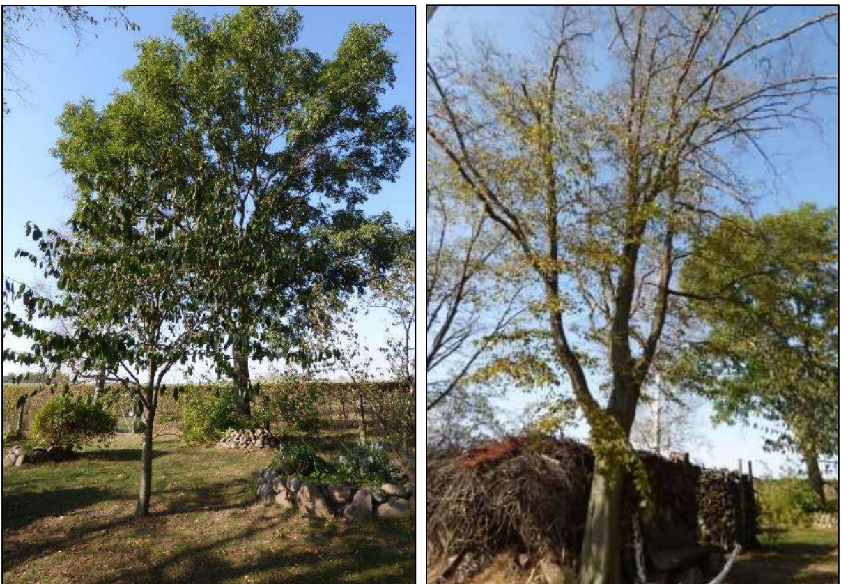
Abb. 5: einzelne mittelalte Esche mit jungem Kirschbaum davor (links) mittelalte Hainbuche (rechts)